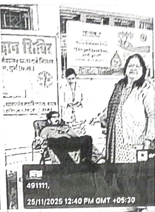
491111, 25/11/2025 12:40 PM GMT +05:30