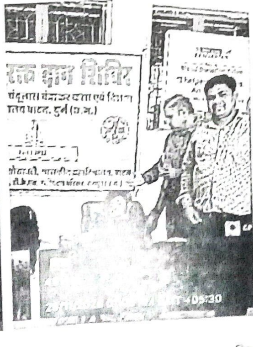
491111, 25/11/2025 01:05 PM GMT +05:30