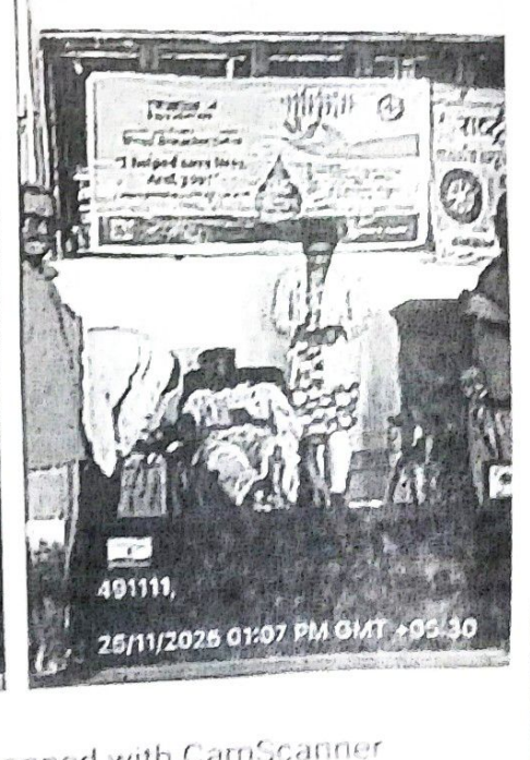
491111, 25/11/2025 01:07 PM GMT +05:30