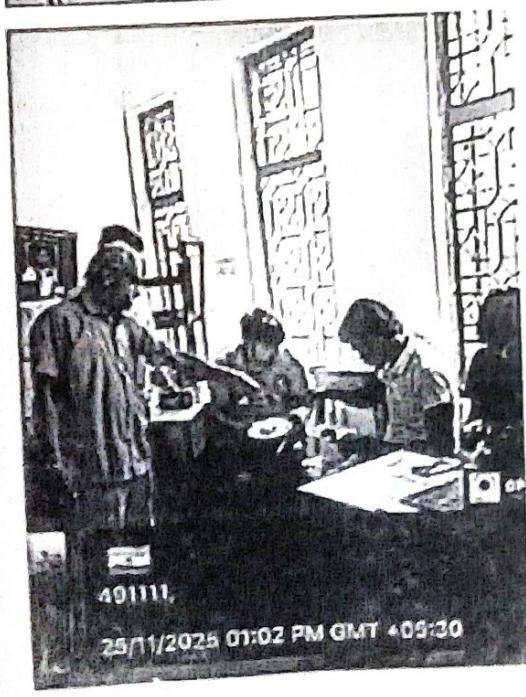
401111, 25/11/2025 01:02 PM GMT +05:30