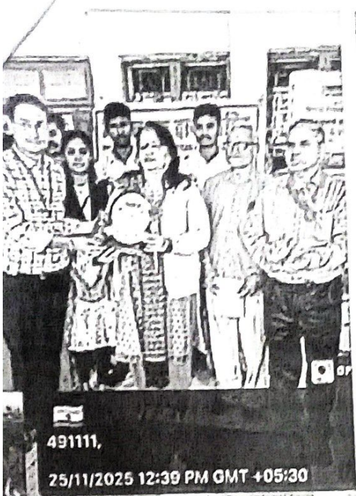
491111, 25/11/2025 12:39 PM GMT +05:30